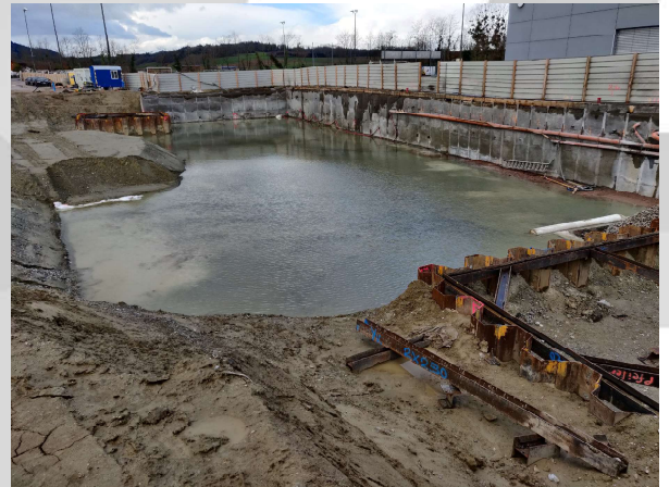
Foto der Erdarbeiten mit Absenkung des Grundwassers

Modellierung der Auswirkungen von Pumpversuchen auf den Grundwasserspiegel