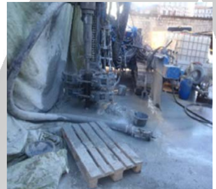
Überwachung von Kernbohrungen

Umweltuntersuchungen für den Bau einer Universitätsfakultät gemäss AltIV und VVEA.