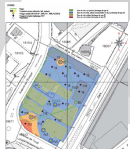
Karte zur Bodenverschmutzung